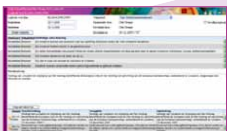
Ontwerpen van lessen en bijhouden van het logboek