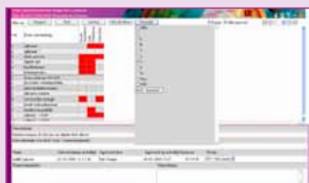
Ontwerpen bijhouden van een persoonlijke leerlijn