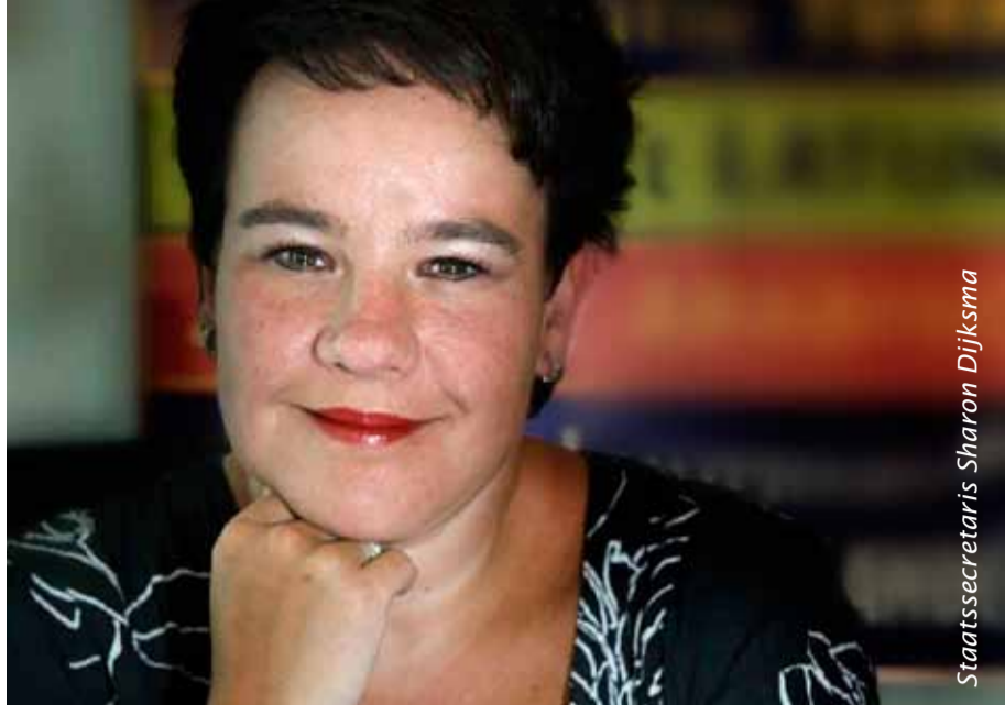
Staatssecretaris Sharon Dijksma